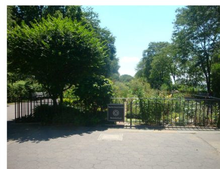
El jardín de la escena final.

"Tienes un e-mail" fue rodada completamente en la zona noroeste de Manhattan, y desde que vi hace tiempo la película había algo de estas locaciones que me atraían considerablemente. En el film, los personajes de Meg Ryan y Tom Hanks siempre hablan de lo mucho que disfrutaban Nueva York en ciertas épocas del año. Así es que me decidí lanzar a la aventura cinematográfica y comencé por el apartamento donde vivía Kathleen Kelly (Meg Ryan) en la 328 West de la calle 89 en el noroeste de Manhattan. Para mi sorpresa no existía el intercomunicador dorado que aparece en la película. Mi segunda locación fue el jardín de la escena final donde se encuentran los protagonistas y Kelly se da cuenta que Joe Fox (Tom Hanks) es su amor cibernético. Esta dirección fue la que más me costó encontrar, caminé y caminé hasta que al fin di con ella, es un parque precioso que se llama River Side Park y el jardín queda en la calle 91, tiene un letrero donde se puede leer "El jardín de la gente" en inglés.