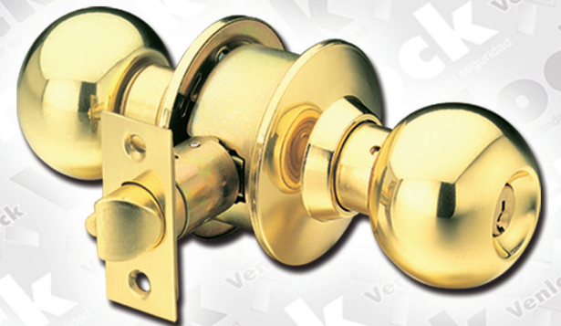
POMO TEPUY Latón Pulido