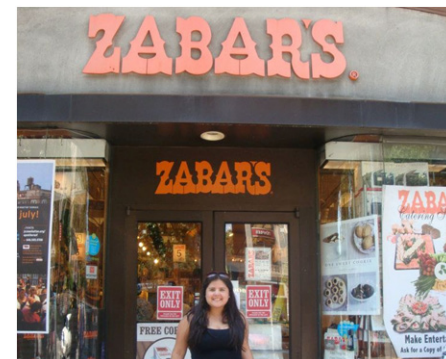
Mini mercado Zabar's.