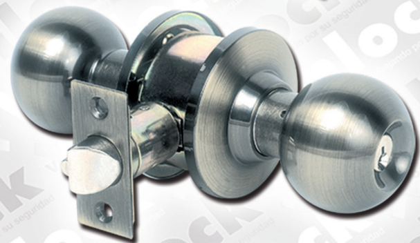
POMO TEPUY Acero Inoxidable