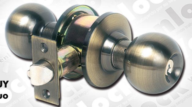
POMO TEPUY Latón Antiguo

Los productos VENLOCK+ son fabricados cumpliendo con la norma ISO 9001.